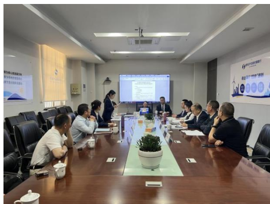
慈利村行召开2023年度股东大会

报告期内，慈利村行监事会召开6次会议，审议或听取议案48项。全体监事勤勉敬业，认真履职，积极参加监事会会议，出席股东大会，列席董事会会议，独立发表意见。