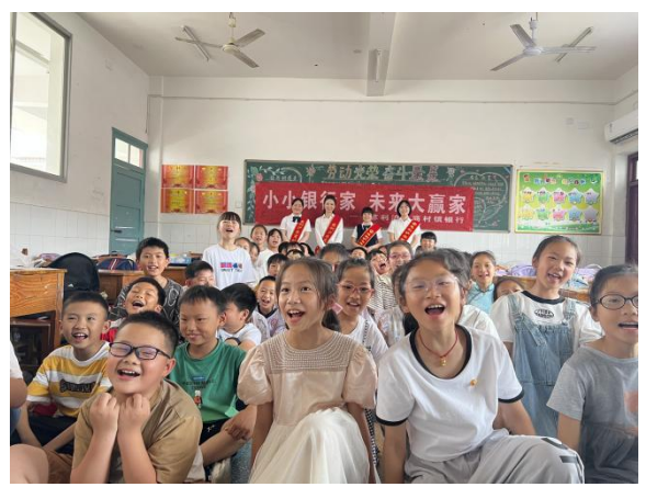
慈利沪农商村镇银行开展普惠金融课堂、流动金额服务站

2. 2023 年，慈利沪农商村镇银行积极落实“一村一机构”相关工作要求，先后前往墨园村、金台村、新旺村等 30 多个村送金融知识进乡村，借助村民会议、村内集体活动等组织金融知识宣传活动，以开展金融知识讲堂进乡村、传统节日村居活动、金融知识小分队入户宣传、送戏下乡、金融知识进校园等多种方式加大力度做好农村金融教育工作，坚守“支农支小”市场定位，消除农村获得金融知识壁垒，截止目前，惠及县域乡村群众 1 万余人。