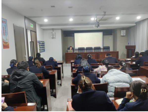
慈利村行开展全行培训