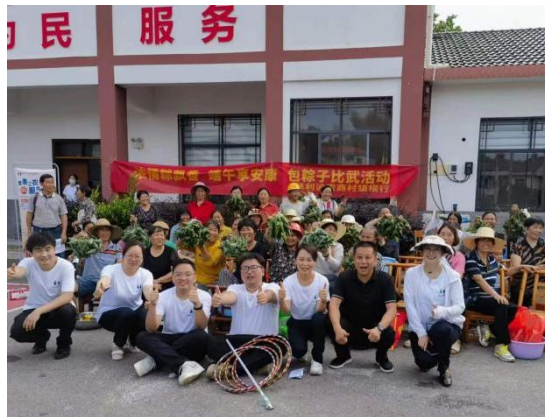
慈利村行走访乡村客户茶田、开展村居活动