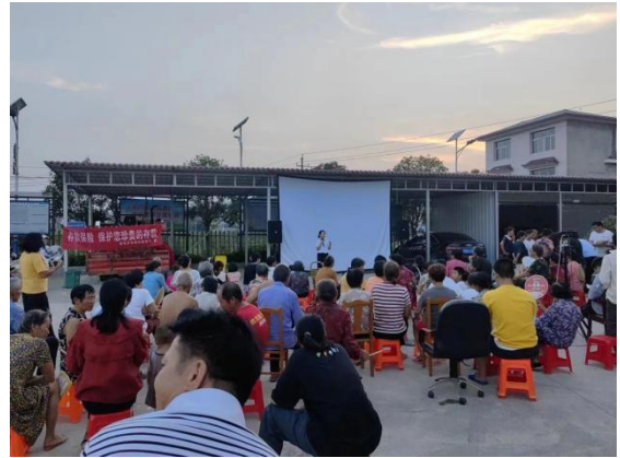
慈利沪农商村镇银行下乡宣传金融知识

3. 为强化宣传效果，慈利村行借助各类在线电子渠道开展宣传，通过手机银行、微信公众号等渠道推送金融知识，扩大受众范围，报告期内，慈利沪农商微信公众号推送存款保险、反洗钱、征信、拒收现金、禁毒、防范电信网络诈骗、防范非法集资等金融知识 20 次，通过线上宣传方式，引导金融消费者远离非法金融活动。