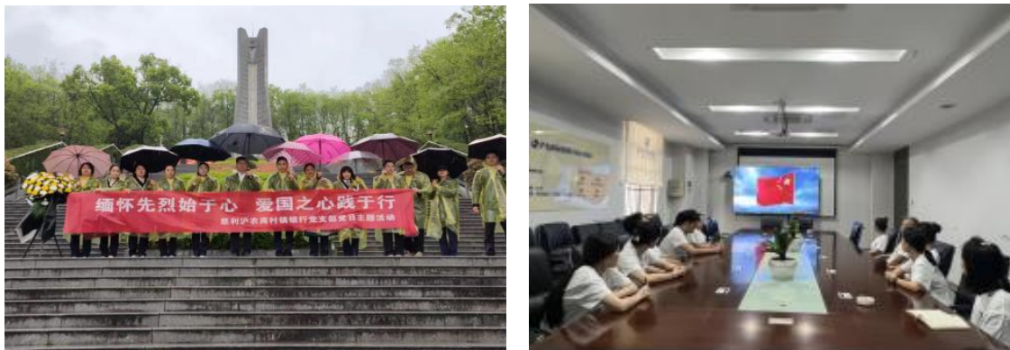
慈利村行党支部开展党日主题活动

2023年7月1日，为庆祝中国共产党成立102周年，深入学习贯彻党的二十大精神和习近平新时代中国特色社会主义思想，进一步增强党员干部国防观念和意识，弘扬爱国主义精神，慈利沪农商村镇银行党支部组织全体党员开展“观影学党史 行动践初心”主题党日活动。此次活动，让全行党员干部接受了一次很好的爱国主义教育，大家纷纷感慨，要立足本职岗位，坚守村镇银行“支农支小”的市场定位，发挥党员先锋模范带头作用，不懈努力，为助力乡村振兴贡献慈利村行的一份力量。