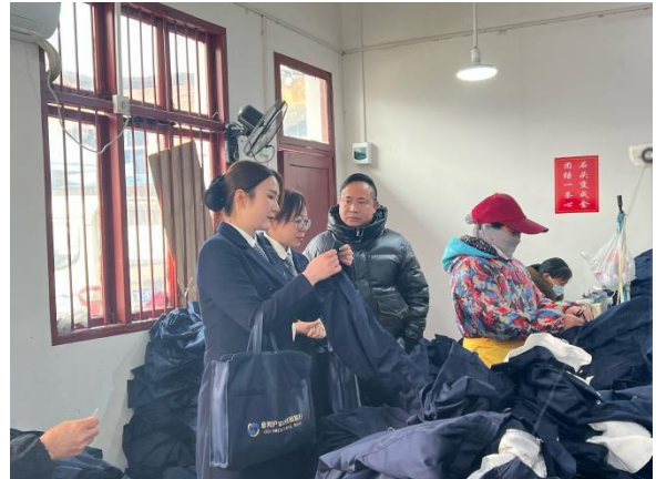
慈利村行走访客户经营地