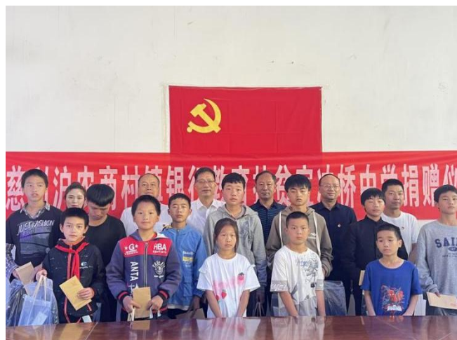
慈利沪农商村镇银行教育扶贫宜冲桥中学

图书活动、利用儿童节组织开展“小小金融家”公益课堂等活动。以金融向善的价值观，切实践行“普惠金融助力美好”的企业使命。