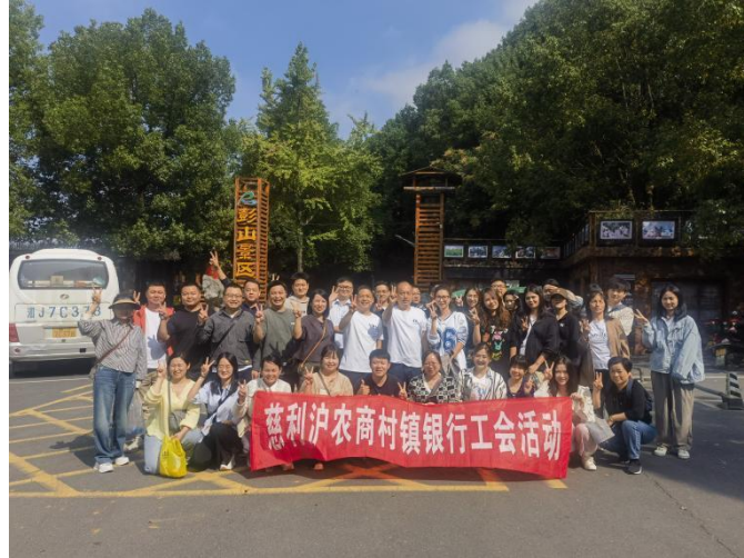
慈利村行开展工会活动