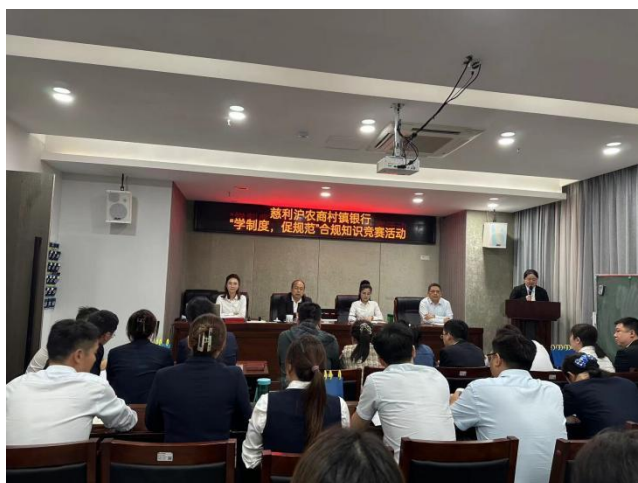
慈利村行开展“学制度，促规范”合规知识抢答赛

慈利沪农商村镇银行以“强化内控管理，夯实发展根基”为合规目标，2023 年开展专项行动，结合《慈利沪农商村镇银行员工违规积分管理办法（试行）》《慈利沪农商村镇银行员工违规违纪行为处理规定》等制度，围绕内控管理现状做实做细工作方案，以制度作为显性管理规则，以方案促行动，开展制度学习，规范操作流程，以部门为单位制订学习培训计划，组织行之有效的合规内容培训、考试，并在 2023 年 10 月 11 日开展“学制度，促规范”合规知识抢答赛，进一步培育合规文化，推进内控合规管理常抓不懈。